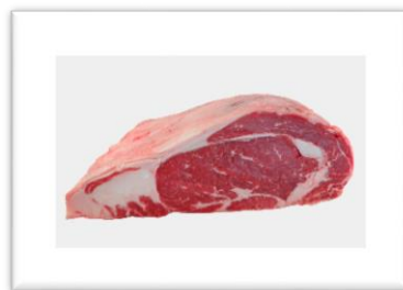
Zdjęcie nr 9