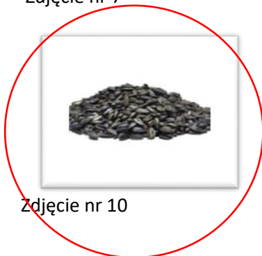
Zdjęcie nr 10