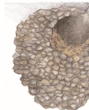
Rysunek nr 4