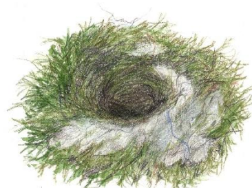
Rysunek nr 2