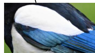
Zdjęcie nr 10