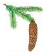
- - smrk