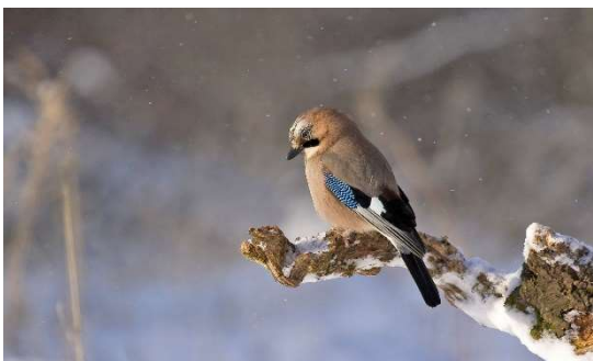
Zdjęcie nr 5 Sójka zwyczajna