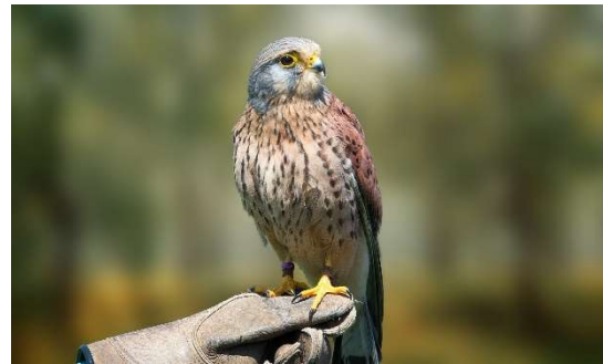
Zdjęcie nr 4 Pustułka zwyczajna