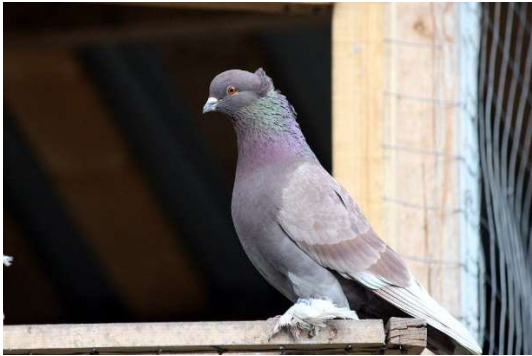
Zdjęcie nr 1 Gołąb domowy