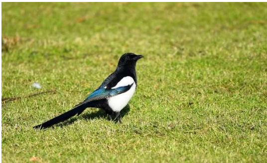
Zdjęcie nr 3 Sroka zwyczajna