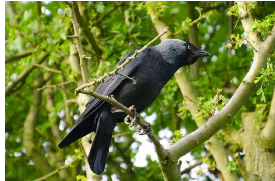
Zdjęcie nr 2 Kawka zwyczajna