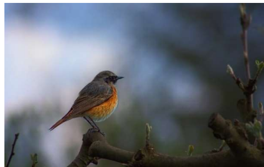
Zdjęcie nr 6 Pleszka zwyczajna