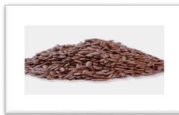
Zdjęcie nr 12