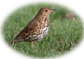
Zdjęcie nr 6