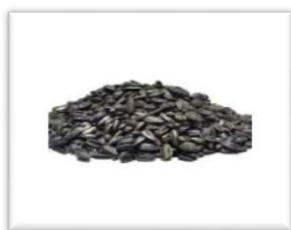
Zdjęcie nr 10