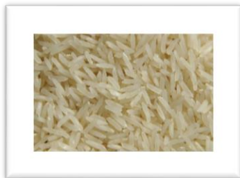
Zdjęcie nr 7

Zaznacz, co możemy dać ptakom do karmnika.