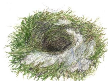
Rysunek nr 2