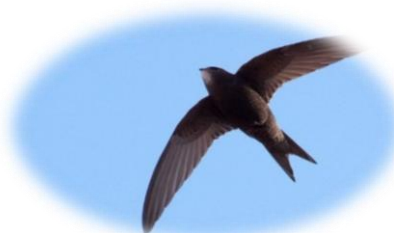
Obrázek č. 7