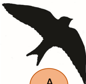
Ilustrace č. 11

Úloha č. 2. Přiřaď písmeno siluety ptačího zástupce k názvu.