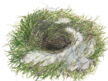
Ilustrace č. 2