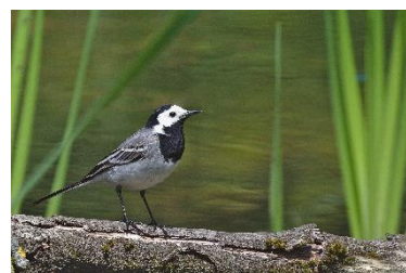
Obrázek č. 5