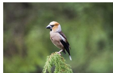
Obrázek č. 3