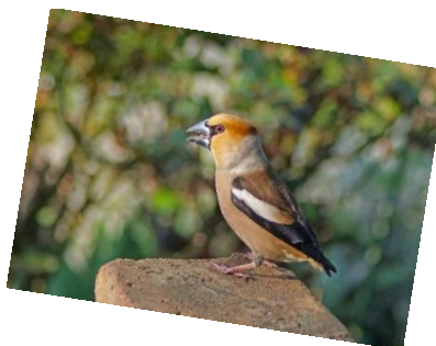
Obrázek č. 8