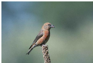
Obrázek č. 1

Rozlušti správný název ptačího zástupce. Poté název spoj s obrázkem.