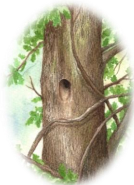
Ilustrace č. 1