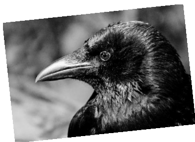
Obrázek č. 7

C) Vrána šedá, dlask tlustozobý, vrabec domácí, hýl obecný, žluna zelená