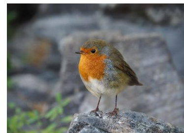
Obrázek č. 6