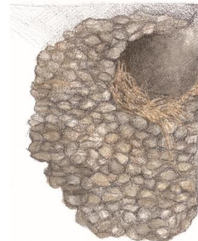
Ilustrace č. 4