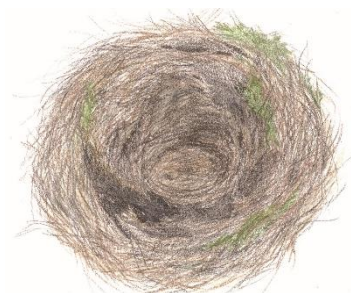
Ilustrace č. 5