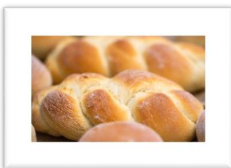
Obrázek č. 11