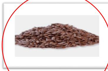
Obrázek č. 12