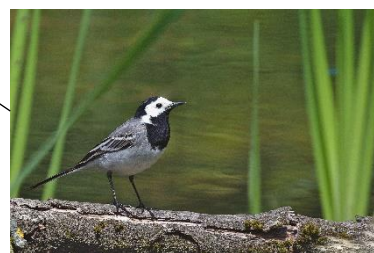
Obrázek č. 5