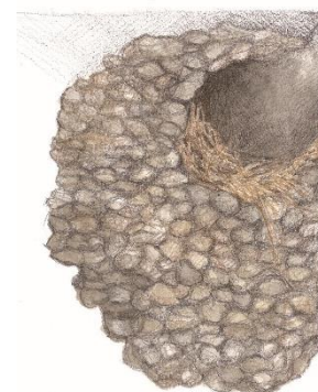
Ilustrace č. 4