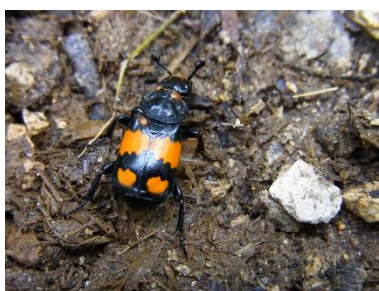
Obrázek č. 10