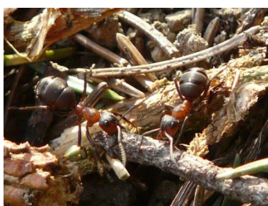
Obrázek č. 11