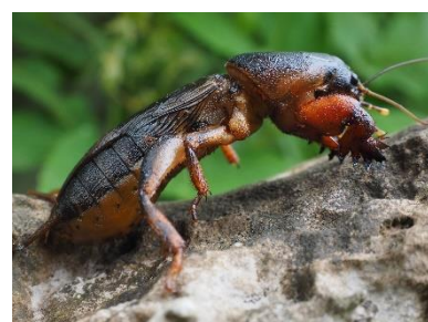
Obrázek č. 12