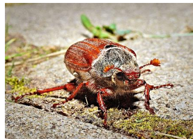
Obrázek č. 9